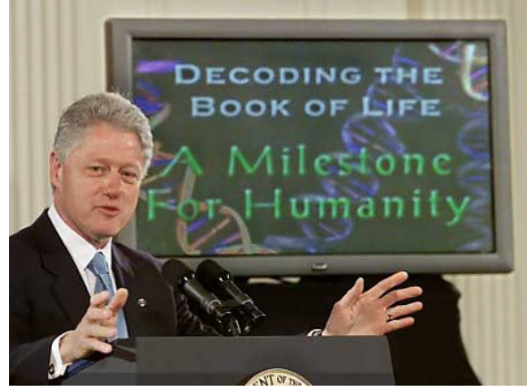
Şekil 2: “İnsan DNA'sı çözüldü”

Kamu yönetimleri istihdam verileri, enflasyon oranları, bütçe açıkları, zamlar gibi muhtelif konularda da sık sık dezenformatik süreçlere başvururlar. Bu onlar için bir algı yönetimidir. Kamuoyunun tepkisini söndürmek için ilgisini yönetmek gerekebilir: Yoğun zam haberleri ile birlikte başka bir sansasyonel konunun gündeme gelmesi, çok da aşına olunmayan bir durum değildir, örneğin. Gayrisafi milli hasılanın büyüklüğüne dikkat çekilirken bütçe açığındaki yükseliş önemsizmiş gibi gösterilebilir. Genellikle bu dezenformatik süreçlerin kurgulaması ve yönetimi için profesyonellerle çalışılır.