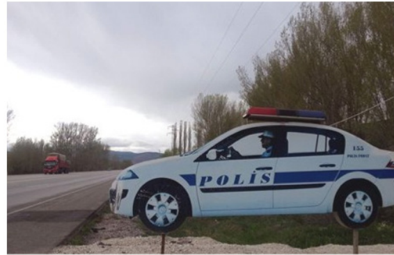
Şekil 1: Polis aracı görünümü pano.

Dezenformatik bilgi üretimi yeni bir olgu olmayıp sosyal yaşamın çeşitli alanlarında, eskiden bu yana kullanılmaktadır. Sözgelimi; bir tarlaya konulan korkuluk dahi bir dezenformasyondur; olmayan bir şeyi varmış gibi gösterme çabasıdır.