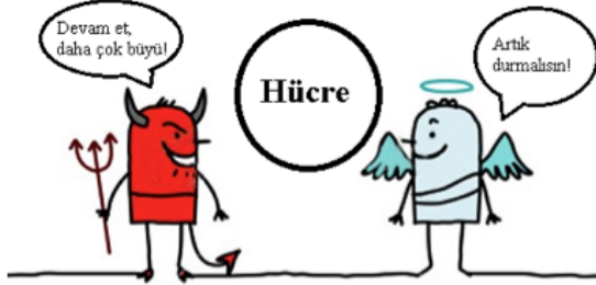
Şekil 5: Kanser bir dezenformasyon sonucudur.

dendir. Oysa durum fazlasıyla normal dışıdır. Kanser de dezenformatik süreç sonucunda doğan bir hastalıktır: Genetik olarak büyüme düzeyi ve şekli tanımlı dokulara daha fazla büyümesi gerektiği yanlışını üreten de bir dezenformasyondur. Bu yönüyle kanser biyolojik yönü kadar enformatik tarafı da olan bir hastalıktır. Doğru enformasyon hayatidir.