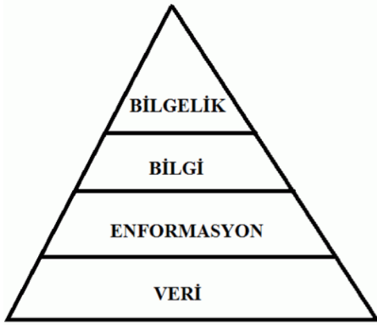
Şekil 3: Doğru bilgi yönetimi hiyerarşik yapısı.

Enformasyon süreci doğru işletilirse; ortaya çıkan ürün, bilgidir; içeriğinde bir anlam barındırır ve bir konuyla ilintilidir. Dolayısıyla işlem süreçlerinde girdi olarak kullanıldığında bir başka enformatik sürecin oluşumuna katkıda bulunabilir.